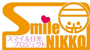
スマイル日光プロジェクトロゴマーク

当プロジェクトの趣旨にご賛同いただき、社会貢献を推進する日光市内の企業であれば、どなたでも参加できます。現在（2019年3月現在）は、27社でプロジェクトを遂行しています。なお、参加企業および寄付つき商品は以下のマークが目印となります。