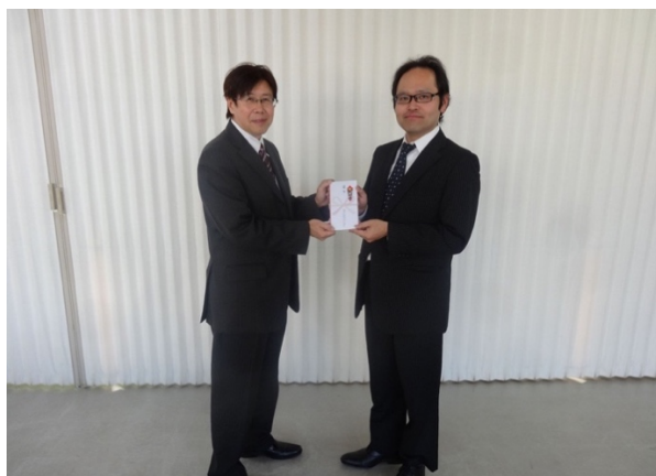
社会福祉協議会事務局長へ(縁人プロジェクト支援金寄付)